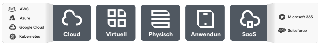
Lokal · In der Cloud · XaaS