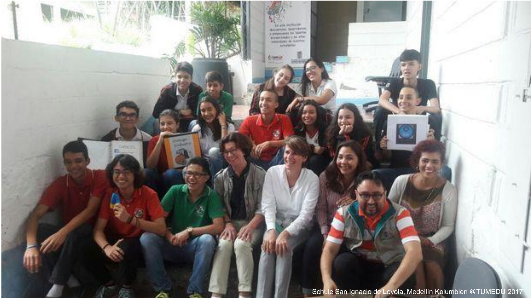
Schule San Ignacio de Loyola, Medellín Kolumbien