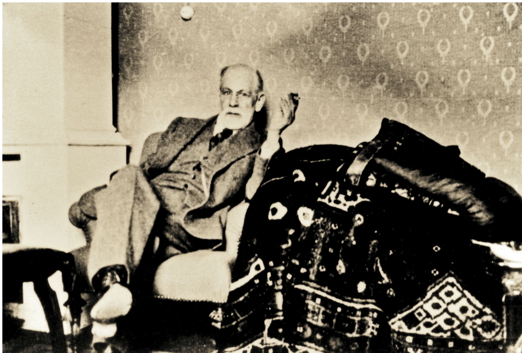
Sigmund Freud auf der Couch um das Jahr 1930. Was der Begründer der Psychoanalyse wohl von der Online-Therapie anno 2019 halten würde?

Beauvais – Im Streit um seine Mütze hat ein 18-Jähriger in der Nähe von Paris einen Lehrer geschlagen und ihm den Kiefer gebrochen. Der Pädagoge einer Fachoberschule habe den Schüler zuvor in einer Pause aufgefordert, die Mütze abzusetzen, berichtete Le Parisien . Der 62-Jährige wurde in einem Krankenhaus behandelt. Der Schüler einer Architektur-Abschlussklasse wurde festgenommen. DPA